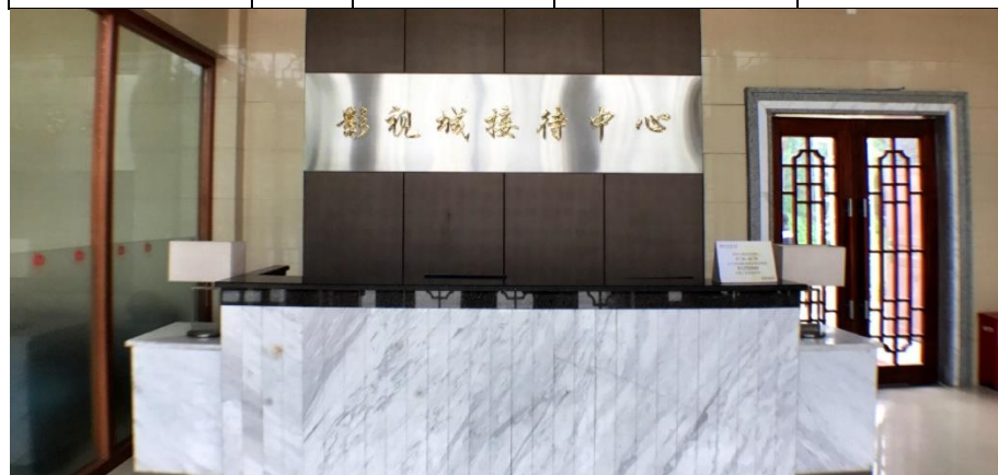
國藝度假酒店接待大堂