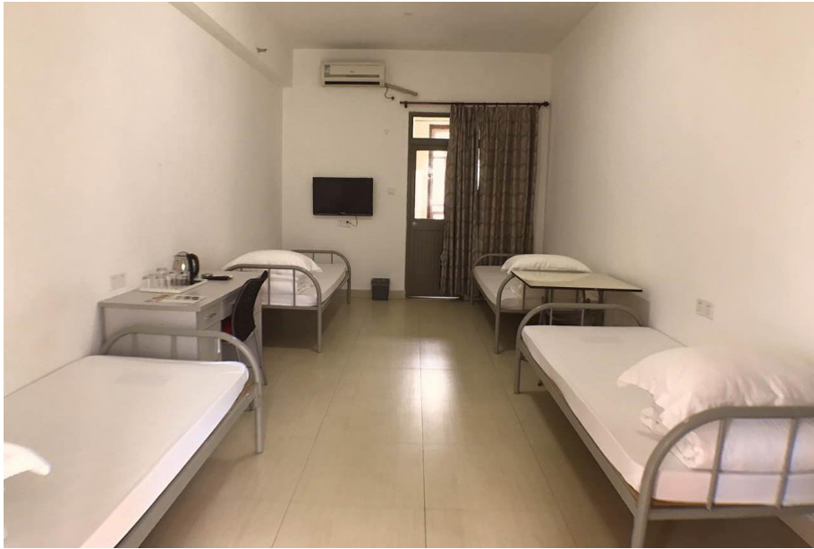
國藝度假酒店接待中心四床房